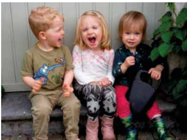
Aangename en stimulerende kinderopvang is voor alle Geelse gezinnen met kleine kinderen een grote meerwaarde.

De Geelse CD&V, met op kop onze OCMW-voorzitster Griet Smaers en schepen Griet Verhesen, wil in de toekomst verder inzetten op bijkomende en vernieuwende kinderopvang.